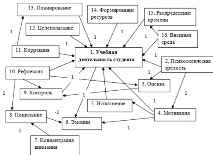
Рис. 3. Детализированная когнитивная модель «Учебная деятельность студента» Fig. 3. Detailed cognitive Student’s Educational Activity Model

Когнитивная модель второго уровня иерархии строится путем замены подсистем их элементами (рис. 3).