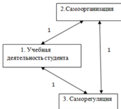
Рис. 2. Упрощенная когнитивная модель «Учебная деятельность студента» Fig. 2. Simplified cognitive Student Learning Activity Model

Когнитивная модель строится в виде знакового графа, в вершинах которого находятся базовые факторы, выявленные в ходе обзора научных публикаций и экспертного опроса, а дуги представляют собой прямые или обратные связи между ними (рис. 2). Базовые факторы делятся на целевые и управляющие. В нашем исследовании «учебная деятельность студента» является целевым фактором, остальные – управляющими. Взаимосвязи между факторами определяются в ходе экспертных рассуждений по схеме: «если А, то В», где А – причина, В – следствие.